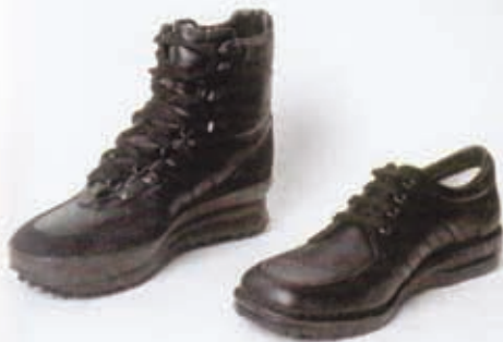
Cipele TRACKING - MIAMI