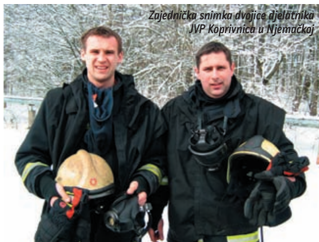
Zajednička snimka dvojice djelatnika JVP Koprivnica u Njemačkoj

- Sa nastavom i boravkom u Njemačkoj bili smo više nego zadovoljni. Vremenski uvjeti za rad nisu bili baš najpovoljniji, radi još uvijek visokog snježnog pokrivača. No, nama dvojici to nije ni najmanje