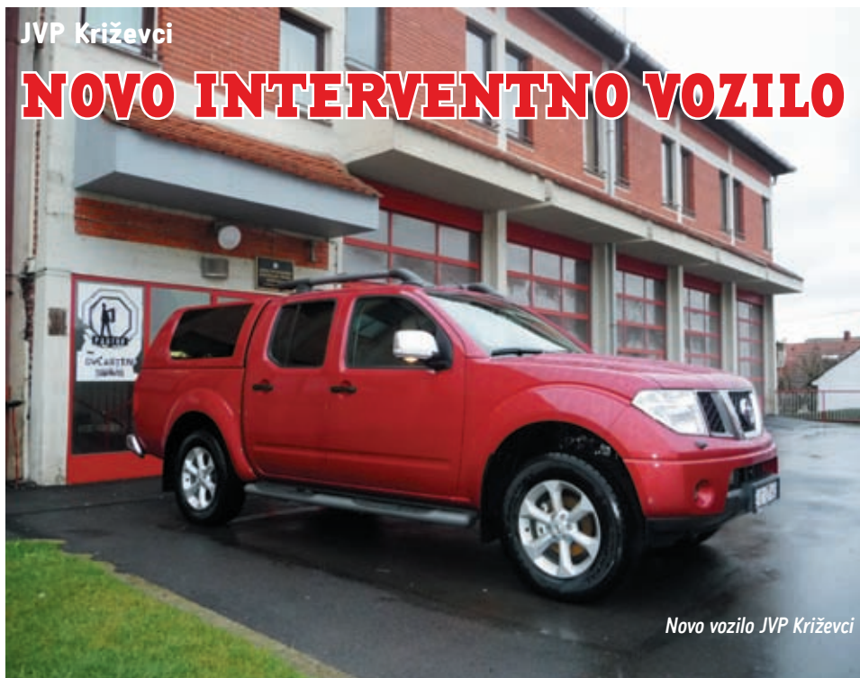
Novo vozilo JVP Križevci

Javna vatrogasna postrojba grada Križevaca nabavila je novo interventno terensko vatrogasno vozilo isključive namjene za tehničke intervencije na području grada Križevaca i pet općina