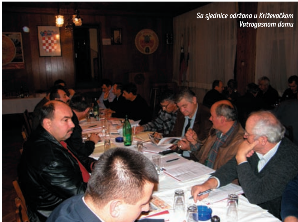
Sa sjednice održana u Križevačkom Vatrogasnom domu