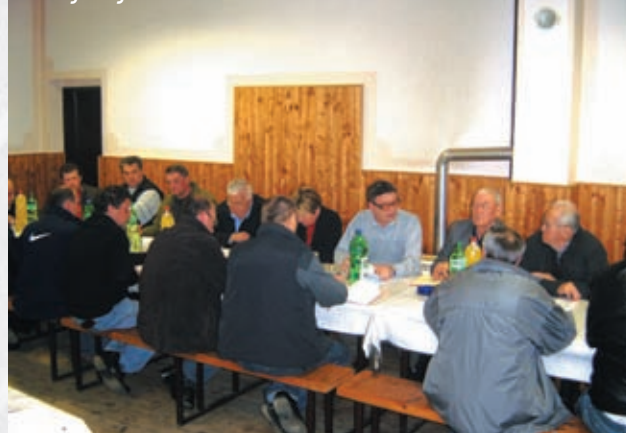
Detalj sa sjednice

je u mjesecu siječnju sa prijavom 58 kandidata, podijeljeni u dvije grupe, od čega je devet odustalo, a četiri su pali na ispitima, dok je 45 uspješno položilo ispite. ☒