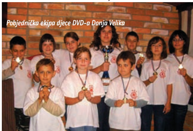
Pobjednička ekipa djece DVD-a Donja Velika

okolnim društvima, Vatrogasnom zajednicom općine, Općinom Sokolovac koja osigurava dio sredstva za rad. U Vatrogasnoj zajednici općine koja je prije imala aktivnih 17 društava danas djeluje i rade DVD Domaji, Peščenik, Donji Maslarac, Ladislav i Gornja Velika. Više nego dobra suradnja je sa Javnim vatrogasnom postrojbom grada Koprivnice i njegovim zapovjednikom Slavkom Tucakovićem, koji su nam u više navrata darivali