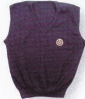
Pulover svečani bez rukava