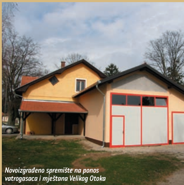
Novoizgrađeno spremište na ponos vatrogasaca i mještana Velikog Otoka