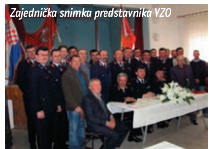
Zajednička snimka predstavnika VZO

obilježiti Dan vatrogastva i Dan svetog Florijana zaštitnika vatrogasaca, organizirati javnu vježbu, osnovati komisiju za pregled rada i opreme u društvima, održavati i poboljšati suradnju sa JVP Križevci te nastaviti daljnju dobru suradnju s Općinom Sveti Ivan Žabno, te aktivno sudjelovati u radu VZ naše županije. Izabrano je i novo rukovodstvo zajednice. Za predsjed-