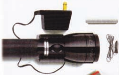
Program svjetiljki MAG LITE i MAG CHARGER