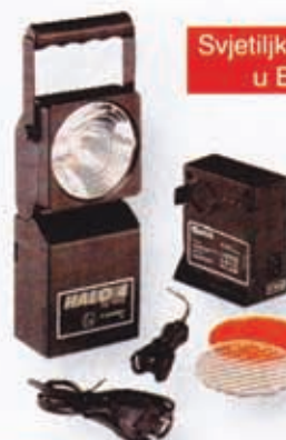
Svjetiljka HALO 4 - T4 u EX izvedbi