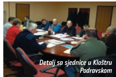
Detalj sa sjednice u Kloštru Podravskom

VZ naše županije. Planom VZ Koprivničko-križevačke županije predviđa se povećanje sredstava za rad sa sadašnjih 360.000 na 390.000 kuna, koja će se podijeliti na tri požarna područja Koprivnica, Križevci i Đurđevac, te 65.000,00 kuna za društva koja će imati slijedeće godine obljernice.