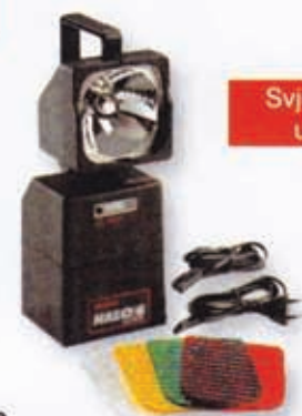
Svjetiljka HALO 6 u EX izvedbi