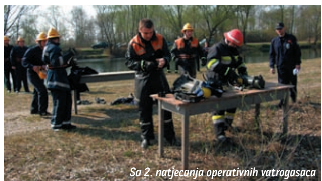
Sa 2. natjecanja operativnih vatrogasaca

Najbolji rezultat imala je ekipa iz Đakova, slijedi Peteranec, Domaji, Odranski Obrež, Stara Sela, Legrad, Kotoriba, Imbriovec, Koprivnica i Hlebine. Prva trojica s najboljim rezultatima primili su prigodne pokale. ☒