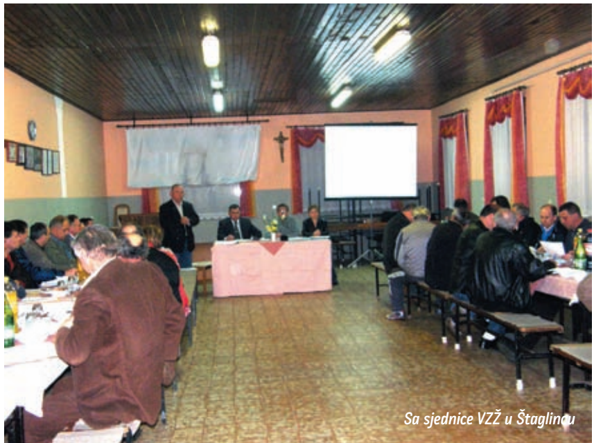
Sa sjednice VZZ u Štaglinu