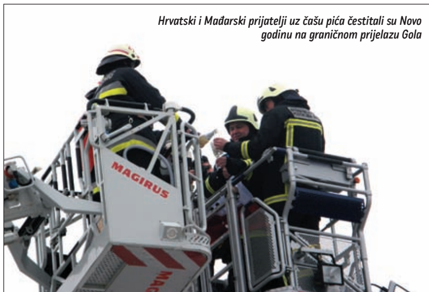
Hrvatski i Mađarski prijatelji uz čašu pića čestitali su Novo godinu na graničnom prijelazu Gola

sudjelovali u ovom prijateljskom čestitanju vatrogasaca na Državnoj granici. Dobro bi bilo kada bi se ovoj zamisli pridružila Turistička zajednica Koprivničko-križevačke županije, bila je misao koja se mogla čuti na ovom susretu. ☑