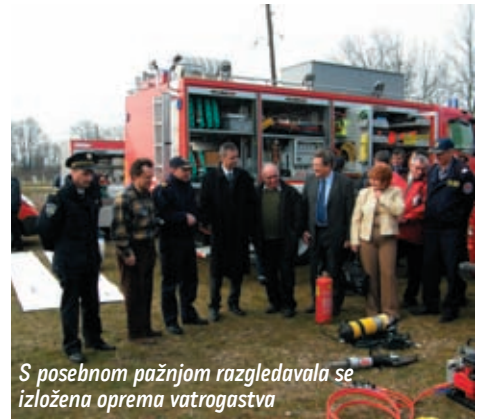
S posebnom pažnjom razgledavala se izložena oprema vatrogastva

slav Flamaceta kratkim izvještajem naznačio je ulogu i ustroj Civilne zaštite koja je sukladno konvencijama i u svijetu prihvaćena standardima civilna zaštita u Republici Hrvatskoj jednako kao i drugdje u svijetu definirana je kao humanitarna djelatnost. Darko Koren rekao je da su vatrogasci kao jedan od najvažnijih čimbenika u