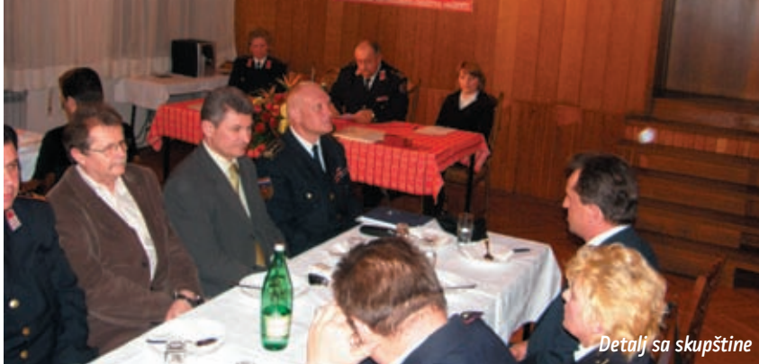
Detalj sa skupštine