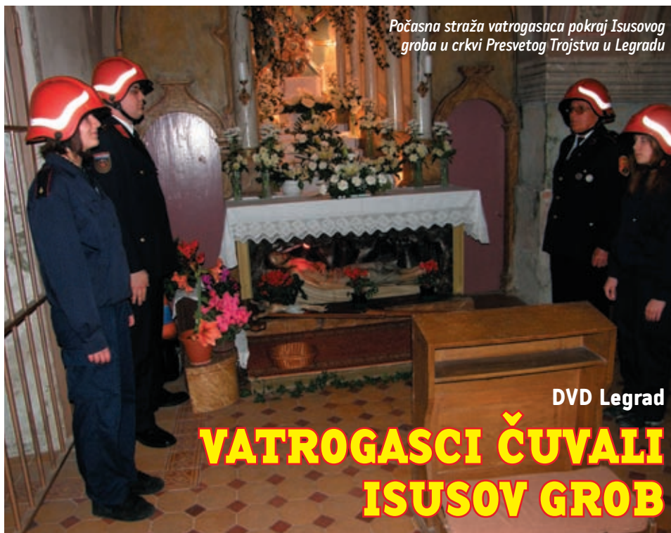
Počasna straža vatrogasaca pokraj Isusovog groba u crkvi Presvetog Trojstva u Legradu