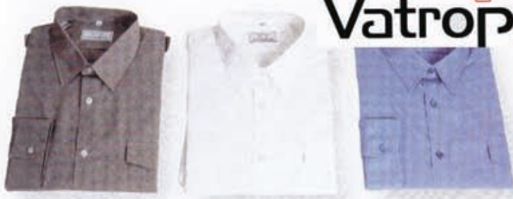
Košulje Luxoria - siva JVP, bijela svečana, plava radna