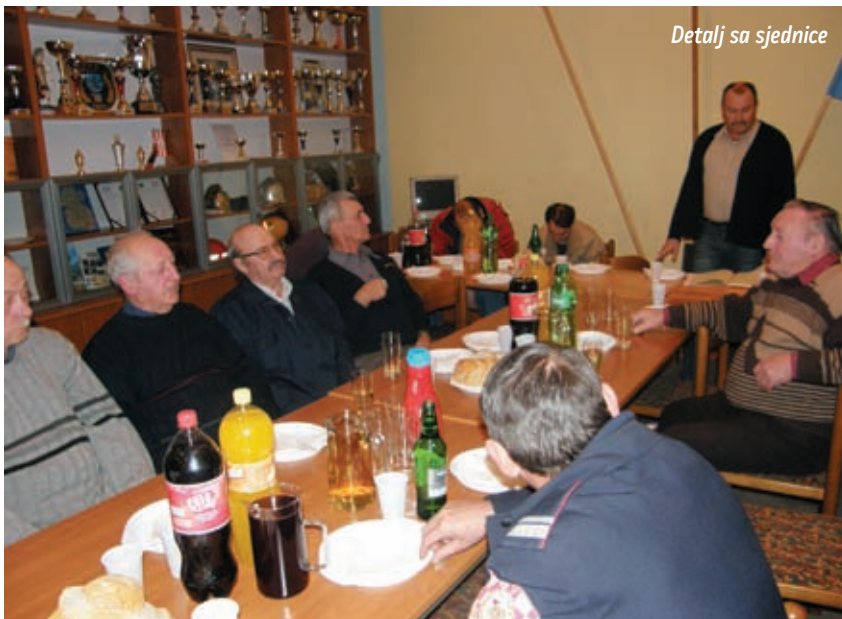
Detalj sa sjednice

su postignuti zapaženi rezultati, posebno na državnom natjecanju u Splitu, tako i u organizaciji memorijalnog turnira Stjepan Paša, a dobri rezultati postignuti su također i u financijskom poslovanju. Pohvalio je rad mladeži koja je postigla dobre natjecateljske rezultate, a osvrnuo se i na ne baš zadovoljavajući rad operativnog dijela članova, misleći pri tome na dozapovjednike društva koji se svojim radom nisu opravdali dano im povjerenje, osim zapovjednika Slavka Tuca-