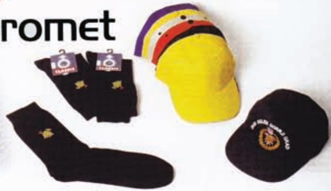
Čarape vatrogasne i kape baseball