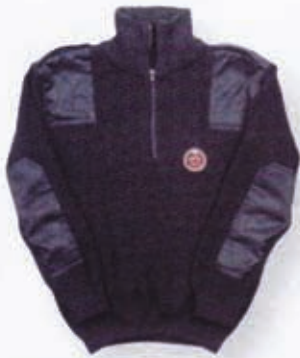
Pulover radni s naramenicama