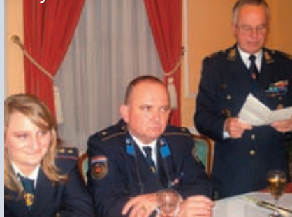
Sa sjednice u Domžalama