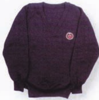
Pulover svečani s rukavima