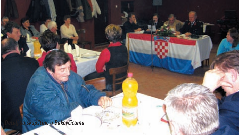
Detalji sa Skupštine u Bakovčicama