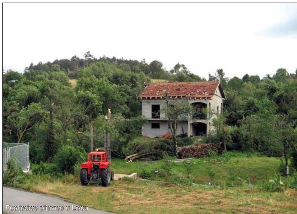
Posljedice pijavice u Lisicu

Uz uklanjanje stabala, vatrogasci su pomagali mještanima i u prekrivanju najoštećenijih krovova radi zaštite od očekivane kiše.