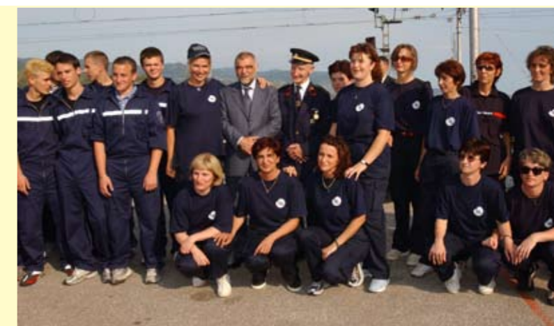
Godine 2004. DVD Škrljevo posjetio je predsjednik RH Stjepan Mesić koji je tom prigodom potpisao pristupnicu i postao član Društva, na veliko zadovoljstvo svih škrljevske vatrogasaca i društvene zajednice

i suradnju s udrugama koje djeluju na području Škrljeva i grada Bakra. Babić je također naglasio kako su škrljevski vatrogasci sudjelovali u svim većim akcijama gašenja požara u Primorsko-goranskoj županiji, a i šire. S posebnim je ponosom izdvojio kvalitetan i sustavan rad s djecom i mladežima koji, uz edukaciju, podrazumijeva i sudjelovanje na regionalnim, državnim, čak i međunarodnim natjecanjima vatrogasne mladeži na kojima škrljevska mladež postiže zapažene rezultate.