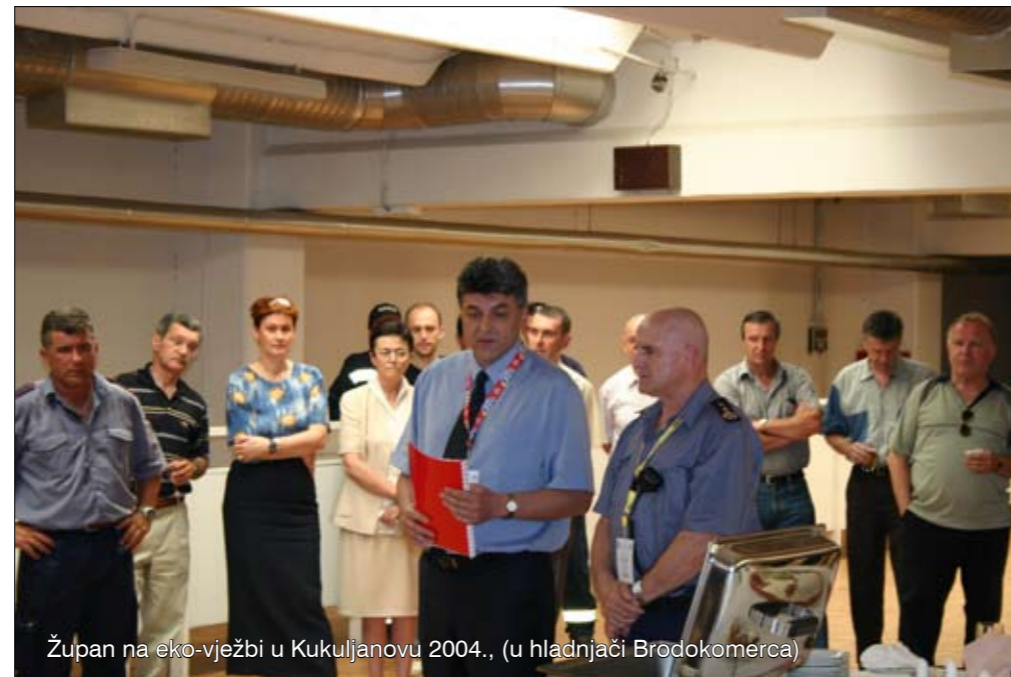
Župan na eko-vježbi u Kukuljanovu 2004., (u hladnjači Brodokomerca)

- Primorsko-goranska županija redovito prati sve aktivnosti vatrogasne struke. Naša je obveza financiranje njihovih redovitih aktivnosti, a sudjelujemo i u sufinanciranju eventualnih povećanih troškova u slučaju izvanrednih situacija. Zapravo je naša zakonska obveza da financiramo vatrogasne zajednice u iznosu od 1 posto od izvornih županijskih prihoda. Svake godine za rad Vatrogasne zajednice PGŽ izdvajamo više od 2 milijuna kuna. Točnije, u 2008. godini radilo se o iznosu od 2.240.000,00 kuna, a u 2009. godini planirano je 2.300.000,00 kuna. Najveći iznos