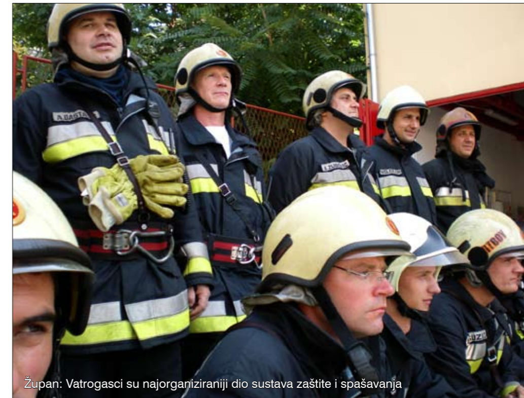
Župan: Vatrogasci su najorganiziraniji dio sustava zaštite i spašavanja

- Prije svega želim izraziti zahvalnost svim hrvatskim vatrogascima što unatoč brojnim opasnostima, svakodnevno pomažu građanima u