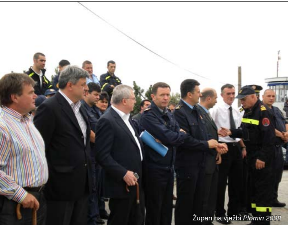
Župan na vježbi Plomin 2008

- Hrvatsko je vatrogastvo trenutačno prepoznato kao vrlo važan čimbenik u društvu. Rane kornatske tragedije svakodnevno nas podsjećaju na važnost i humanost te struke. No, bez obzira na vrstu i težinu, svaki problem ima i svoje rješenje. Zadatak države i jedinica lokalne i regionalne samouprave jest da svatko u svojim mogućnostima i zakonskim ovlastima eventualne probleme pomogne riješiti. Osobno sam uvijek za konstruktivne prijedloge i dogovor, na dobrobit svih građana – kaže župan te dodaje: - Slažem se s mišljenjem vatrogasnoga vodstva da je osnovni problem organizacijske naravi nepostojanje jednog tijela koje bi sustavno pratilo razvoj vatrogastva. Sasvim je jasno da bi se na takav način ranije uočavali problemi, a i dolazilo do adekvatnih rješenja.