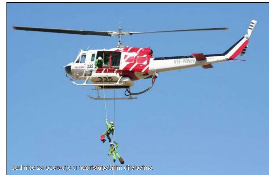
Jedinice za operacije u nepristupačnim dijelovima

Važan dio čine i zračne snage. Gašenje iz zraka vrlo je učinkovito. Primjerice, u sezoni 2006/07. zračne su snage imale 8726 sati letenja! U Australiji se koriste i infracrvene kamere kojima se može otkriti požar nevidljiv zbog raslinja ili dima.