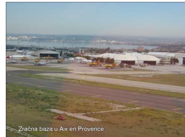
Zračna baza u Aix en Provence

zemlje. On je također izrazio nadu da će suradnja Francuske i Hrvatske biti još veća.