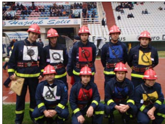
Paukovec, Mladost Kaštel Sućurac, Jalševac Breški, Biškupec, Čazma te JVP Grada Čakovca, a od gostiju slovenska ekipa.

Inače, najbolje rezultate u Splitu su postigli DVD-ovi