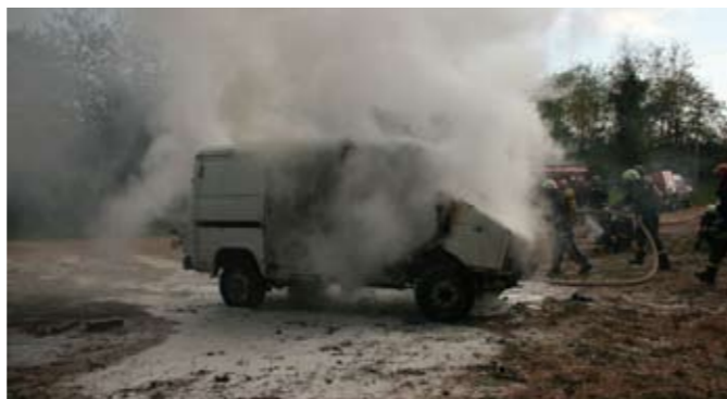
za zvanje „vatrogasac I. klase“. Time je ovogodišnji plan osposobljavanja na području Liburnije uspješno zaključen.

Uz spomenute „novopečene“ vatrogasce, četrnaest vatrogasaca DVD-a Lovran i Kras položilo je ispit