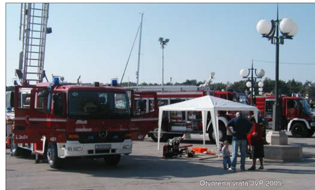
Otvorena vrata JVP 2005.

ide u zajedničke kapitalne projekte. Jedinice lokalne samouprave dodatno (i to s 1/3 sredstava) financiraju i plaće djelatnika javne postrojbe – kaže Petrov te pojašnjava