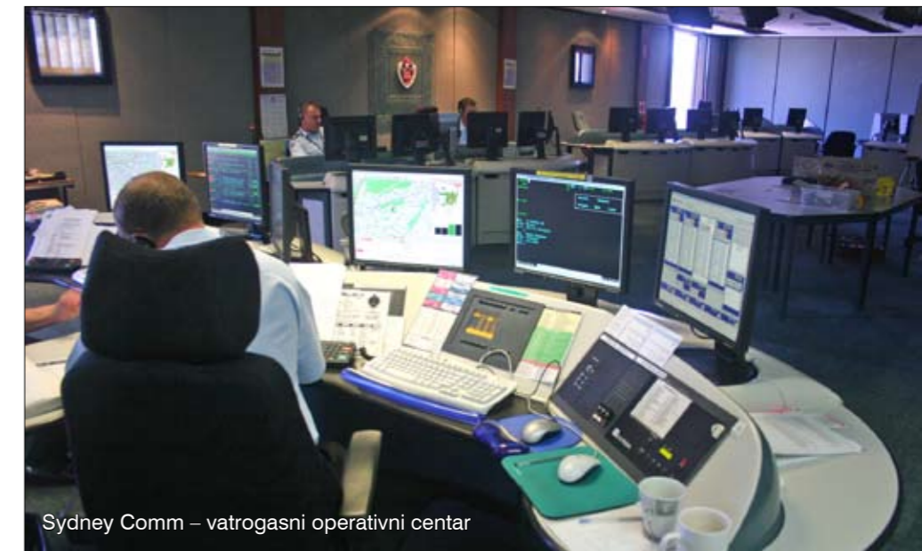
Sydney Comm – vatrogasni operativni centar

uglavnom se bavi požarima otvorenog prostora, ali nisu isključene ni druge vrste intervencija.