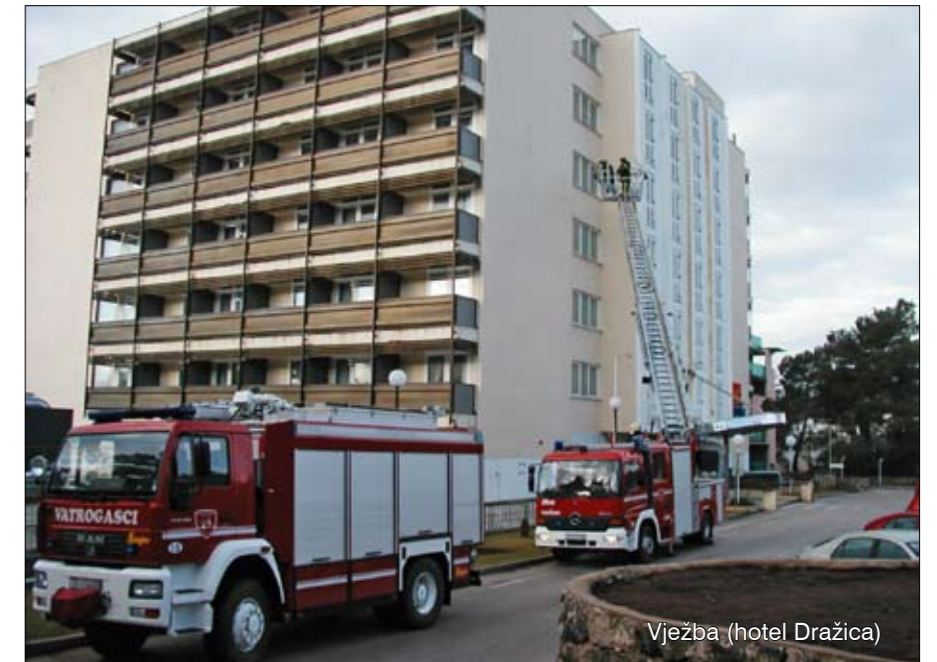
Vježba (hotel Dražica)

Do kraja 2012. godine za sve DVD-ove nabavit ćemo nova vozila – pojašnjava Petrov. Prošle godine vozilo je već dobio DVD Baška,